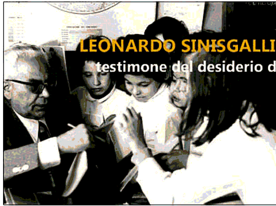
L'immagine scelta per la locandina del convegno