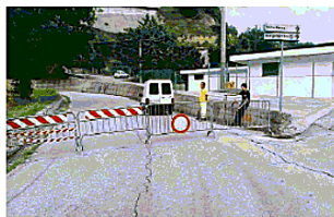
LA SP 42 E L'INCENDIO Strada sbarrata