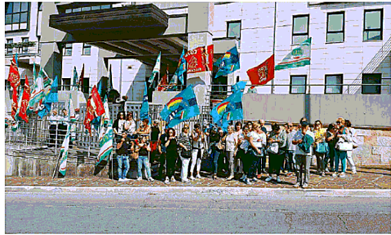
PRESIDIO I 74 lavoratori addetti alle pulizie del Crob di Rionero in Vulture ieri hanno manifestato davanti la Regione Basilicata

«Auspichiamo, in tempi brevi - hanno aggiunto poi i sindacati - che la Presidenza della Regione, la Giunta, il dipartimento sanità, il Consiglio Regionale, ognuno per le proprie competenze e sensibilità, si adoperino con la dovuta efficacia, affinché questa questione possa trovare una rispettosa, definitiva e auspicabile soluzione». A rispondere all'appello Vito Marsico, direttore generale della Regione Basilicata, presente all'incontro di ieri, che si è assunto l'impegno di chiedere a breve un incontro in Prefettura a Potenza e di convocare in Regione un tavolo politico alla presenza, oltre che dei sindacati, anche degli assessori regionali competenti e dei responsabili delle aziende sanitarie per fare una verifica sulla questione degli appalti in regione. Dovranno quindi ancora attendere i 74 lavoratori, almeno sino alla prossima riunione la cui data non è stata ancora fissata.