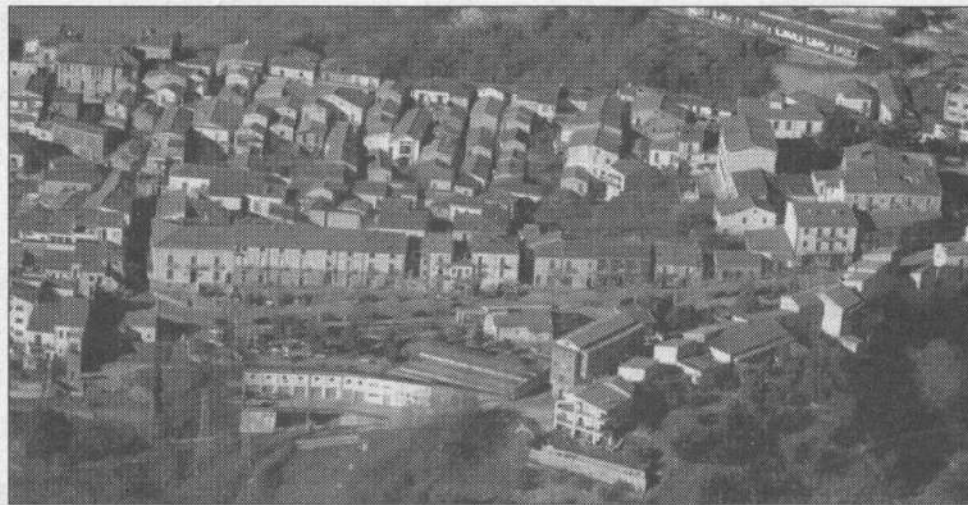
Sopra uno scorcio di Montemurro. Sotto il poeta ingegnere e la sede della Fondazione

Nella seconda giornata - sabato 19 ottobre alle ore 10 - Silvio Ramat incontrerà gli studenti delle scuole superiori provenienti dal Liceo Scientifico di Marsico Nuovo e dal Liceo Classico di Viggiano, con i quali discuterà del tema "Intorno alla natura della poesia".