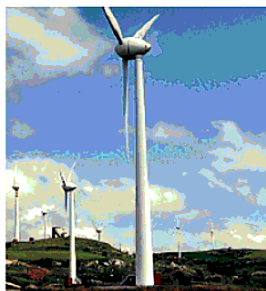
VENTO Pale eoliche

● Si apre un nuovo fronte della protesta contro l'eolico selvaggio. Una raccolta firme per impedire che a pochi metri dal centro abitato di Salandra possa sorgere un impianto di mini-eolico è stata lanciata sulla piattaforma online change.org dal gruppo «Salandra Scrive», con l'obiettivo di sensibilizzare la cittadinanza sul tema. Al momento ha raccolto poco meno di cento firme, ma, hanno reso noto i promotori, la raccolta prosegue. La petizione vuole dunque combattere la nascita dell'impianto, che dovrebbe sorgere «a pochissimi metri dal centro urbano di Salandra».