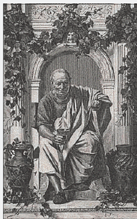
Il poeta Orazio

Il Consorzio ha definito il provvedimento un segnale di attenzione verso un'iniziativa che unisce la dimensione culturale del territorio alla sua identità enologica. La scelta di dedicare l'appuntamento ad Orazio, nato a Venosa, viene interpretata come un modo per intrecciare la memoria letteraria alla valorizzazione del patrimonio vitivinicolo lucano, con l'Aglianico del Vulture indicato