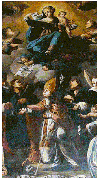
"Madonna con Bambino e Santi", V. A. Conversi

rente la santità, tratta dall'Ecclesiaste, mentre nel cartiglio è riportato un versetto in latino del Vangelo di Marco (3,15). La tela si trova nella chiesa di San Giovanni Battista e già denominata Santa Maria la Nova. Tutti i santi rappresentati da Conversi nella tela riflettono esattamente la devozione popolare di quella parte di Matera compresa tra il Sasso Barisano, l'antico ambito dei Foggiali, così denominato per la presenza delle fovee, cioè di strutture atte alla conservazione del grano, e il Piano della Pontana.