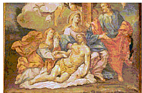
"Deposizione della croce" olio su tela (cm 207 x cm 156) - autore ignoto

POTENZA In alto il logo di Sogنالibro e l'interno della libreria