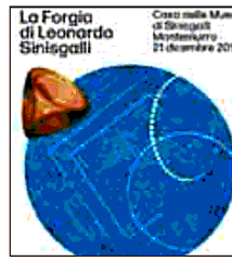
l'Inaugurazione dell'esposizione "Un carciofo in mostra. Sinisgalli e la Su-

l'inaugurazione dell'esposizione "Un carciofo in mostra. Sinisgalli e la Su-