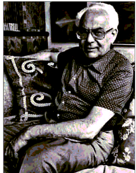
Sinisgalli, il suo libro e la locandina dell'evento

POTENZA - Dopo l'atteso ritorno in libreria dallo scorso 8 ottobre, il "Furor Mathematicus" di Leonardo Sinisgalli, con un saggio introduttivo e la cura di Gian Italo Bischi, fresco di stampa per Mondadori fra gli Oscar Baobab Moderni, i cui diritti sono stati acquistati grazie al contributo del Fondo etico di Bcc Basilicata, verrà presentato ufficialmente mercoledì 23 ottobre alle