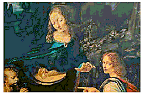
ARTE Il dipinto della Vergine delle Rocce con le sue tante imperfezioni

ciostro della Vergine più lungo del normale, la vicinanza del piccolo Giovannino alla Madre del Bambin Gesù e viceversa, il Bambin Gesù lontano da sua madre. Ma il particolare più anomalo risiedeva proprio in quel pannello della Vergine: giallo, passa da un braccio all'altro della Vergine e si lascia modellare dal suo peso, formando curve morbide. Stranamente, però, proprio all'altezza del ventre della Madonna, queste curve si spezzano dipanandosi in forme spigolose, assumendo una consistenza metallica e luminosa. Carlo Pozzoli, di Classico Seta, una tra le più importanti aziende comasche e del mondo che producono seta seguendo le antiche tradizioni artigianali, ha accettato una mia sfida, regalandomi una interessante con-