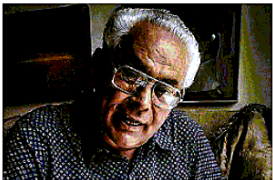
POETA Leonardo Sinisgalli nativo di Montemurro

Una divinità e un essere umano. Si ispira a loro il progetto «Proteus», che andrà in scena a Montemurro dal 2 al 4 maggio. Coprodotto dal Comune con Fondazione Matera Basilicata 2019 per Capitale per un giorno, il progetto prevede 7 aree tematiche e altrettanti percorsi con i quali celebrare la natura poliedrica e la capacità di trasformarsi di Montemurro. Tutto ciò grazie al lavoro sinergico tra Amministrazione comunale con Scuola del Graffito Polistrato, Associazione Bellivergari, Gruppo Caritas, Fondazione Leonardo Sinisgalli, Pro-Loco, Associazione Maya, Gruppo Lucano di Protezione Civile. Il 2 maggio alle 10, nella sala convegni San Domenico, in piazza Albini, momento istituzionale cui prenderanno parte i rappresentanti della Fondazione Matera Basilicata 2019, allietato dalla musica del Complesso Bandistico Città di Montemurro. Alle 11, nella sede della Scuola del Graffito,